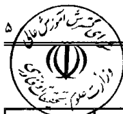
جدول (۱) دروس عمومی